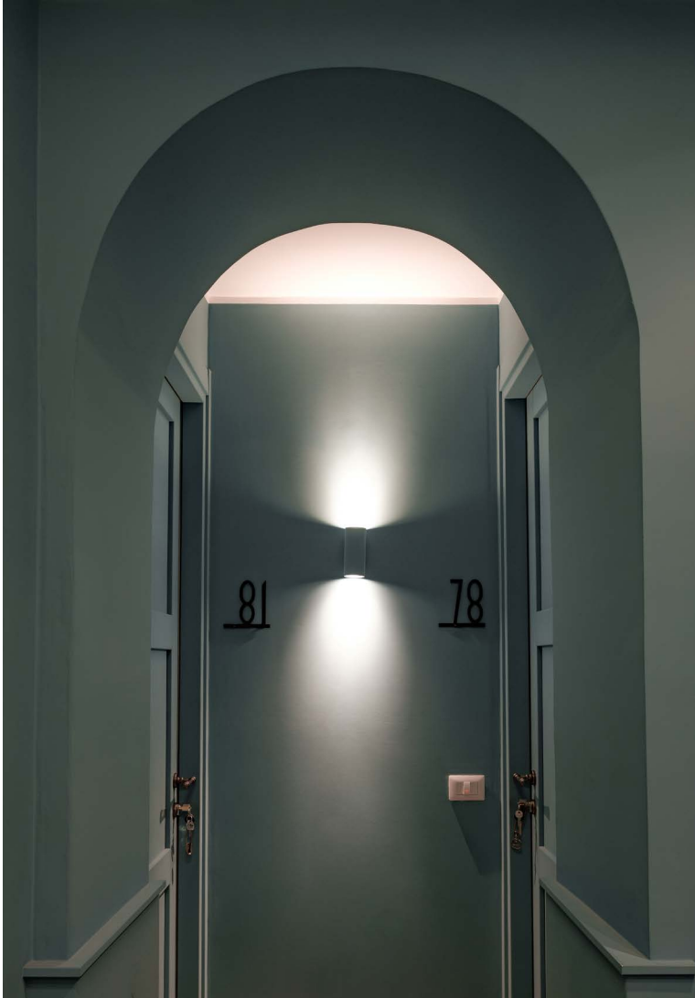
ph Access room and Entrance detail - Ozio