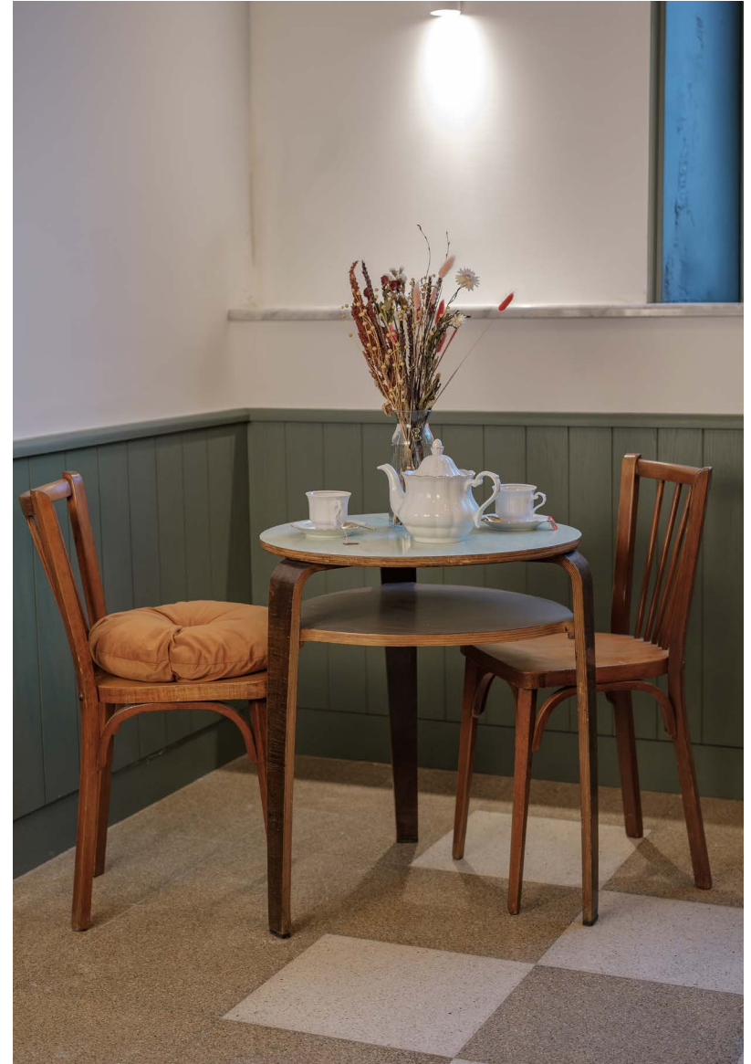
ph Breakfast room and Light detail - Ozio